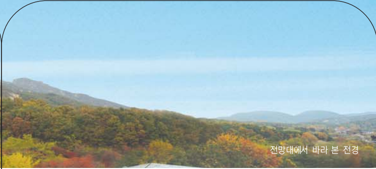
전망대에서 바라 본 전경

히어리, 화살나무 등 관목 주위에 돌을 쌓고 그 틈에 야생화를 심어 이른 봄부터 겨울까지 감상할 수 있다.